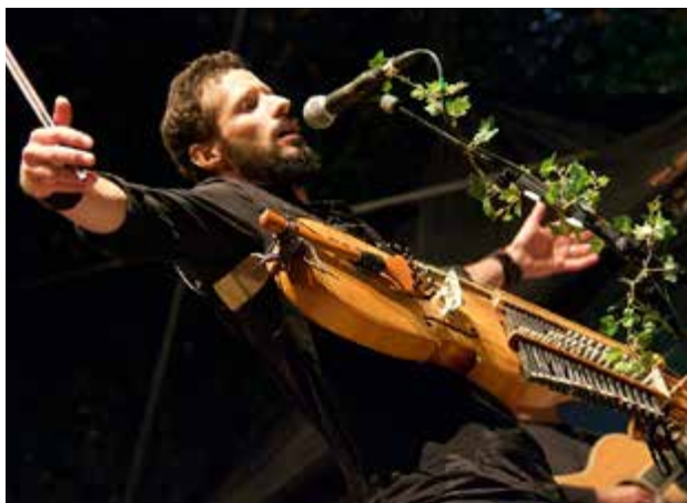
Bric A Drac

Poly Sons reste attentif aux besoins des groupes qui y viennent, afin d'améliorer les conditions de répétition.